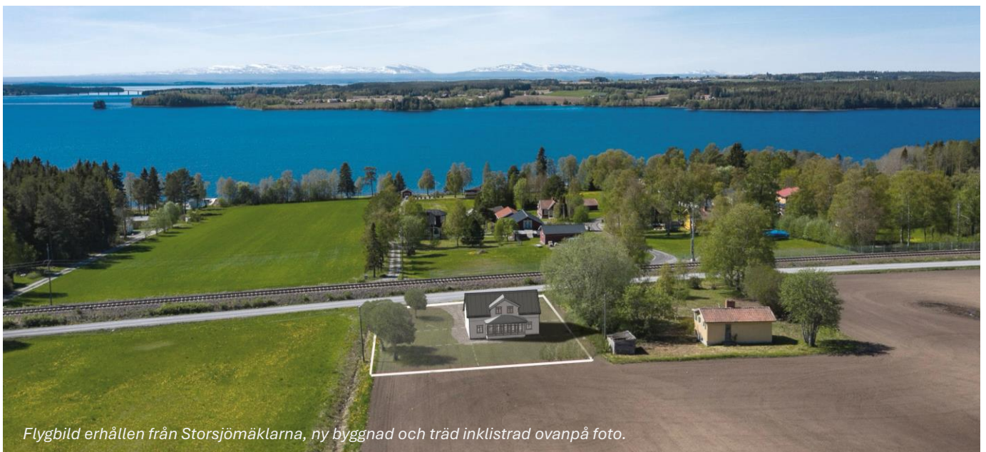
Flygbild erhållen från Storsjömäklarna, ny byggnad och träd inklustrad ovanpå foto.

I detta skissförslag finns inritat en generös markstensbelagd uteplats som sträcker sig från öster över gaveln i sydlig riktning till väster, där bästa solläget är från tidig morgon till eftermiddag. Här kan utemöbler placeras och sommarmiddagar avnjutas med vacker vy över Storsjön.